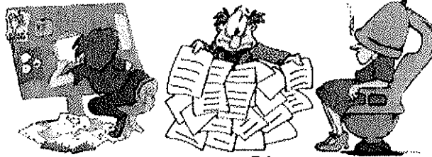
Publicista traductor, a peluquero, a